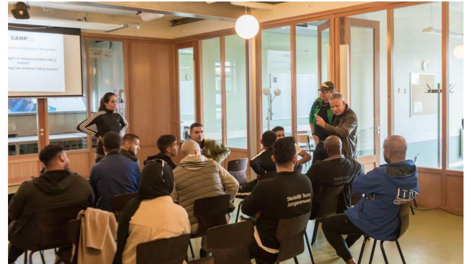
Jongvolwassenen – Camp21