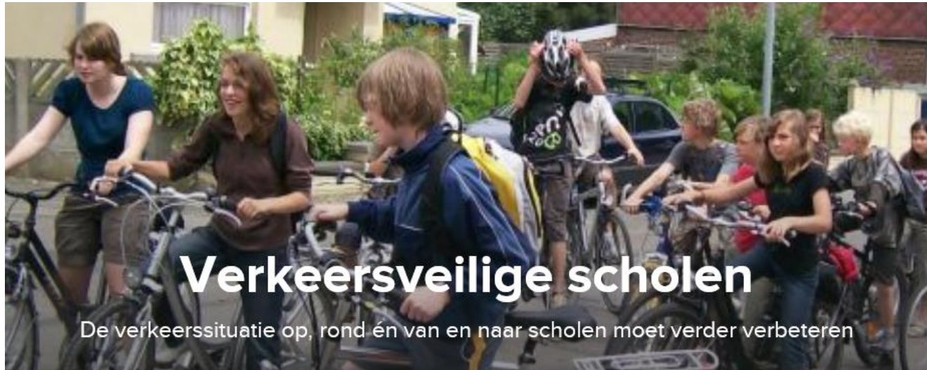
Kinderen - Verkeerseducatie