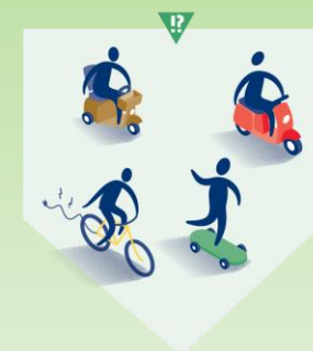
Kwetsbaar en onervaren